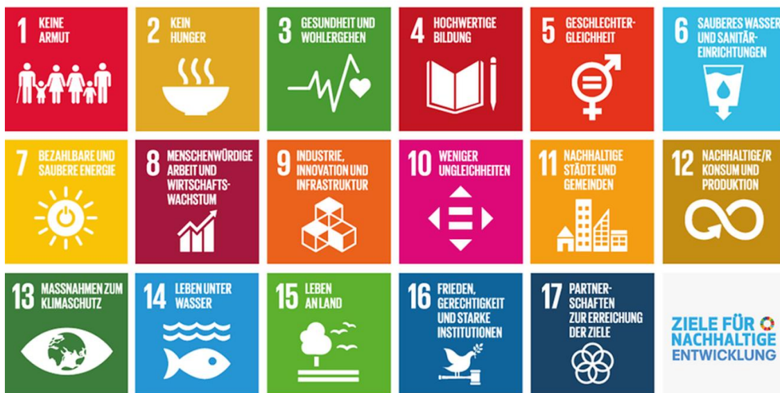
Abbildung 2 – Die 17 Sustainable Development Goals nach Beschluss der UNO

2. In welchem Umfang der Kreis bereits nachhaltig agiert wird nochmals besonders deutlich, wenn die im September 2015 von den Mitgliedsstaaten der Vereinten Nationen im Rahmen der Agenda2030/ Nachhaltigkeit verabschiedeten 17 Ziele (sogenannte Sustainable Development Goals – SDGs) betrachtet werden. Die Tabelle im Anhang führt die auf Grundlage der Arbeit der kommunalen Spitzenverbände heruntergebrochenen Ziele der SDGs für die Kommunen auf.