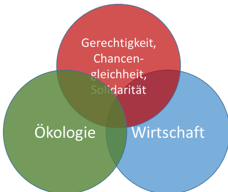
Abbildung 1: Drei Säulen Modell für Nachhaltige Entwicklung